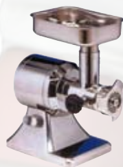
FTS127 Tritacarne elettrico 12 gruppo macinazione inox 1 Hp - monofase