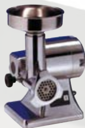
Tritacarne elettrico 8 gruppo macinazione inox 1,5 Hp - monofase