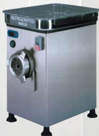
FTR101 Tritacarne refrigerato 22 1,5 Hp - monofase