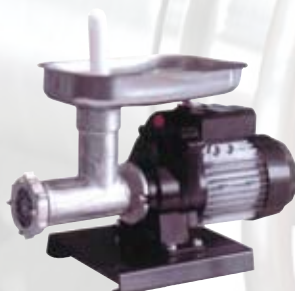
TC12ECO Tritacarne economico 12 0,8 Hp con set per insaccare monofase - Extra CE