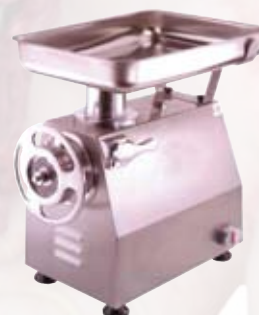
FTI133 Tritacarne elettrico carenato V 22 gruppo macinazione inox 1,5 Hp - trifase