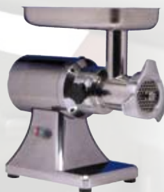
FTS139 Tritacarne elettrico 32 gruppo macinazione inox 2 Hp - monofase