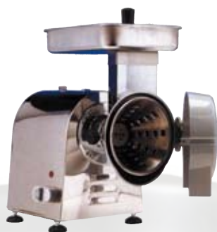
FTM106 Tagliamozzarella 22l 1,5 Hp - monofase