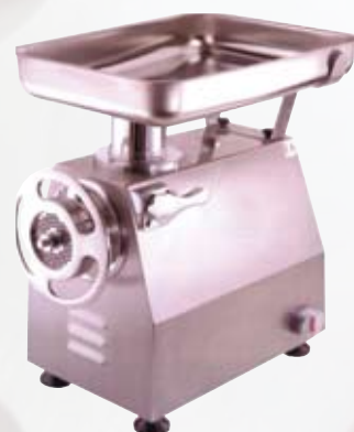
FTI139 Tritacarne elettrico carenato V 32 gruppo macinazione inox 3 Hp - monofase