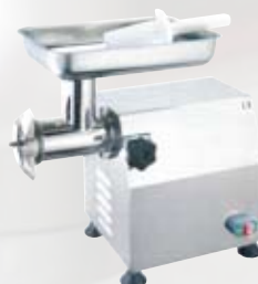
FTI137 Tritacarne elettrico carenato 22 gruppo macinazione inox 1,5 Hp - monofase