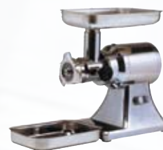
FTS137 Tritacarne elettrico 22 gruppo macinazione inox 1,5 Hp - monofase